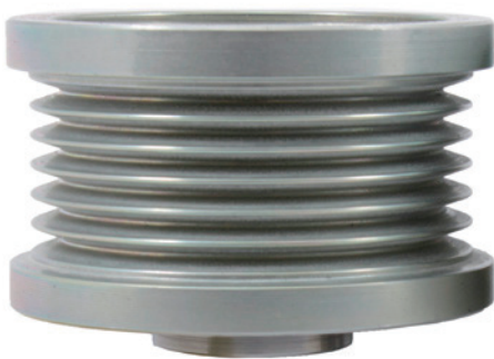
画像 2： INA オーバーランニングオルタネータープーリー 535 0202 10 (6 溝付き)

100-A オルタネーターを搭載した上記の型式では、 エンジンの補助ユニットドライブを 5 または 6 溝付 き V リブドベルトシステムとして設計できます。